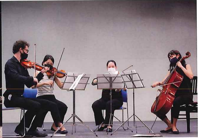
第11回 サマーコンサート