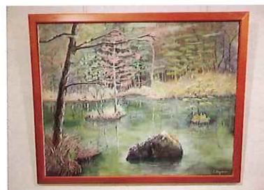
90歳を超えた方の作品

30年以上の長い間継続している水彩画豊水会の展示会が開催された。今回が24回目である。当ギャラリーの常連と言ってよく、この季節に馴染みのある会である。日ごろは売布の教室で月2回腕を磨いているとの事。現在は7名で何れも70歳以上であるが、展示されている絵を見る限り何れも生き生きとした筆のタッチが感じられる。中には90歳を超える会員の作品があり、その絵の堂々とした力強さには驚かされた。この会の目標の画風は具象的に描くとの事で、被写体をよく観察し、遠近や色の強弱、鮮やかさ、光の具合などを上手く調和させて、構図をしっかりすることだと会員の方が語ってくれたが、それ以上に大切なのは何より楽しく描くことだそうだ。展示してある20数個の作品それぞれに上記の技法が丁寧に組み込まれ、更に作者の個性がはっきりと現れている。現在この会を指導されておられる日本水彩画会の伊藤先生の指導が素直に会員に伝わっているのがよく分かった。例外なくレベルの整った素晴らしい絵画展であった。来年もこの季節を楽しみにしておこう。(NL部会)