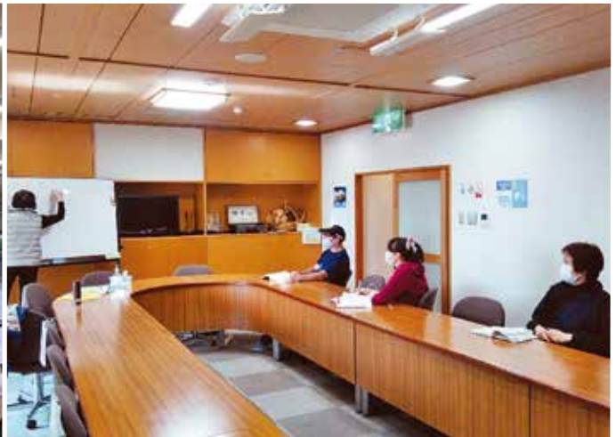
くらんど日本語教室、宝塚ジョイア(母語教室ポルトガル語)、日本語教室の様子