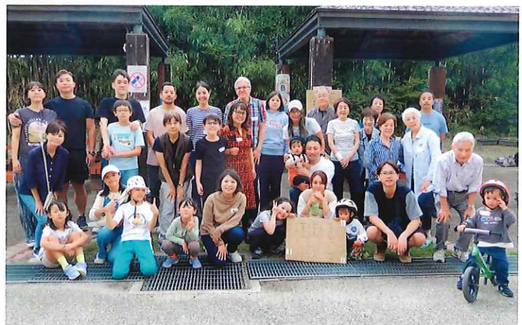
外国人のためのバーベキュー