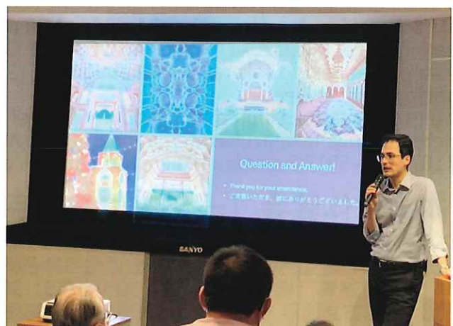
多文化交流ひろば