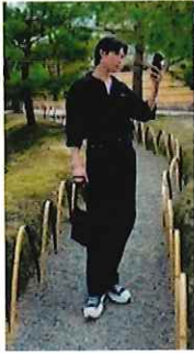
イーさん (ベトナム人) くらんど日本語教室学習者